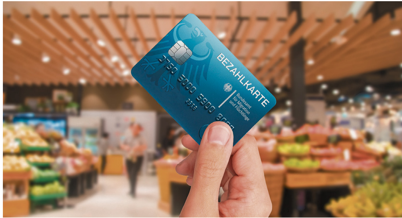
Bezahlkarte statt Bargeld für Asylbewerber

Überweisungen ins Ausland werden unterbunden