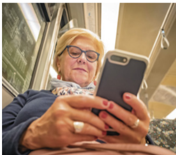
Mit der BVG sind Fahrgäste auch unterwegs online

Berlins Straßenbahnen sollen jetzt komplett mit WLAN ausgestattet sein, bei den mehr als 1500 Bussen soll dies bis Ende März 2024 geschehen. U-Bahnen werden schrittweise mit der Inbetriebnahme neuer Züge ausgestattet. Das teilte die Senatsverkehrsverwaltung auf Anfrage der CDU-Fraktion mit.