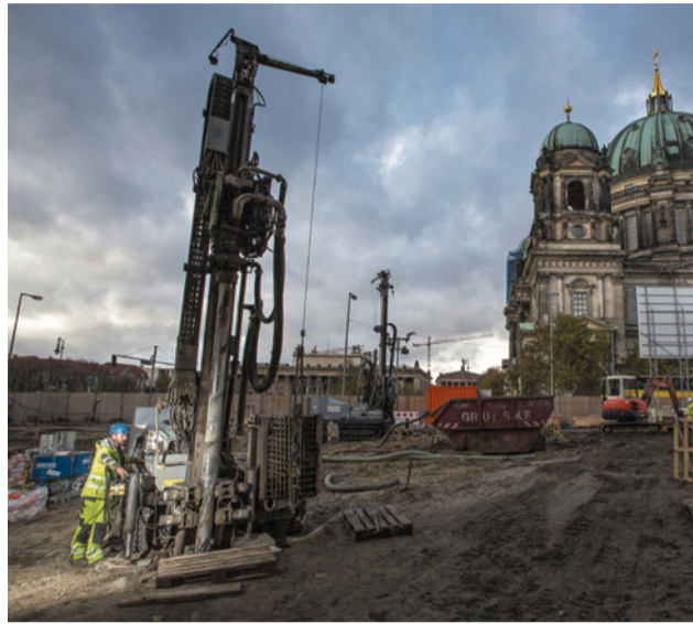
Erdwärme, die klimafreundliche Energie der Zukunft für Berlin nutzen

Saubere Kartierung, Analyse und Bohrungen machen die Erschließung von Geothermie nicht ganz einfach, aber wenn die Erschließung erfolgreich war, erhält man eine verlässliche und im Betrieb günstige Energiequelle. Zusätzlich verringert in Berlin produzierte Geothermie die Abhängigkeit von anderen Energiequellen aus dem Ausland. Ein wichtiger Punkt in der aktuellen Weltlage. Deswegen muss die