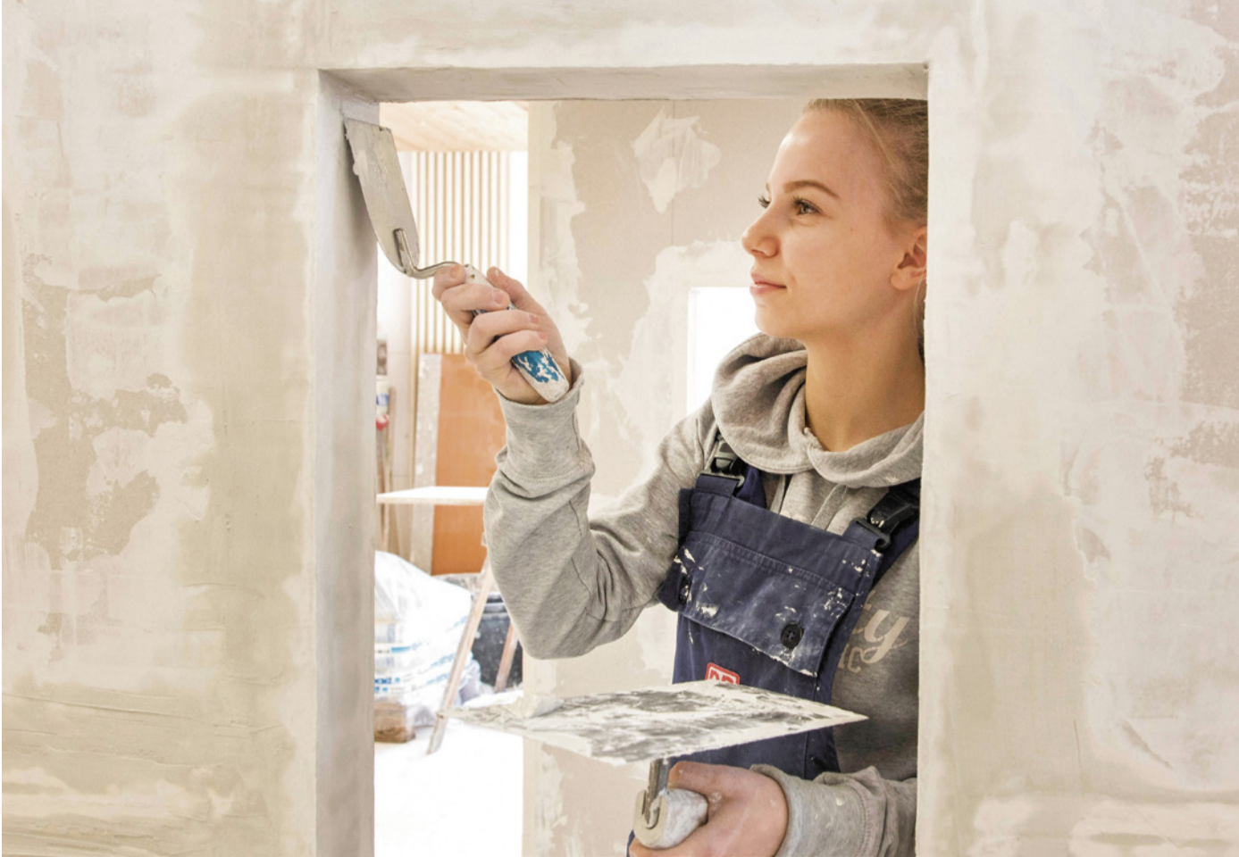
Übung macht den Meister und die Meisterin. Fachkräfte wie sie werden mehr denn je gebraucht. Die Kostenbarriere soll fallen