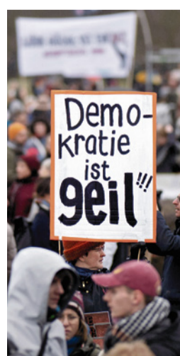
Protest gegen Extremismus

Der CDU-Politiker appellierte an alle demokratischen Kräfte: „Lassen Sie uns gemeinsam dafür sorgen, dass die Menschen wieder von der Demokratie begeistert sind.“