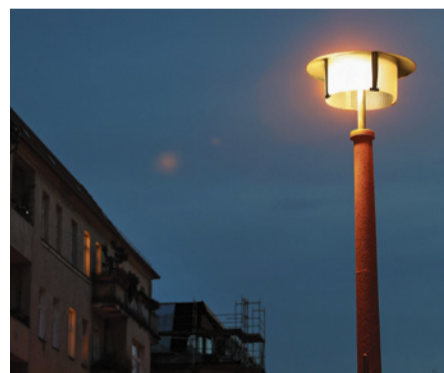
Laterne repariert, Licht geht

Frau Beate D. wandte sich an unsere Kummer-Nummer, da sie nicht mehr weiterwusste. Seit mehreren Wochen schon funktionierte die Straßenbeleuchtung vor einigen Häusern in ihrer Straße nicht mehr. Auf ca. 60 Metern der Straße war es stockdunkel. Glücklicherweise war es noch zu keinem Unfall gekommen. Wir setzten uns mit der zuständigen Senatsverwaltung in Verbindung und erhielten die Antwort, dass die Netzkabel gewechselt werden müssen, dazu mussten aber auch die Kabelübergangskästen gewechselt werden. Diese Arbeiten mussten zu diesem Zeitpunkt witterungsbedingt ver-