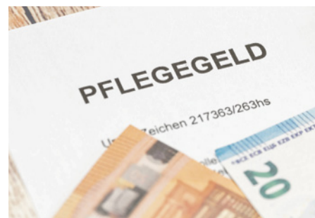
Schnelle Hilfe bei der Pflege

i Wenn auch Sie etwas auf dem Herzen haben, die Kolleginnen und Kollegen der Kummer-Nummer der CDU-Fraktion Berlin stehen an Ihrer Seite. Hier die Nummer gegen Ihren Kummer: 030-23 25 28 37 (montags von 15 bis 17 Uhr, donnerstags von 9 bis 11 Uhr und freitags von 10 bis 12 Uhr) oder per E-Mail an hilfe@kummer-nummer.de .